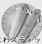
はにわスティックパン