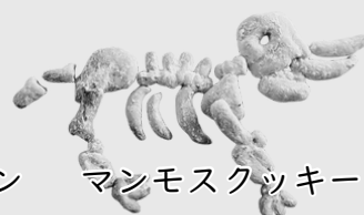
マンモスクツキー