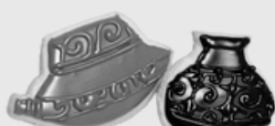
ウルシングクツキー