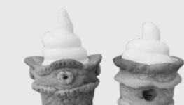
土器アイスクリーム